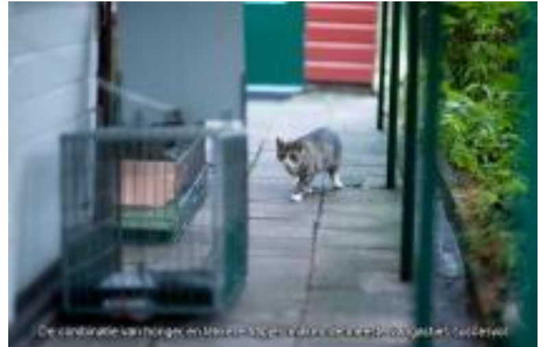
De combinatie van honger en nieuwsgierigheid zorgt ervoor dat katten toch komen.