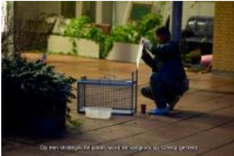
Op een strategische plaats wordt de vangval nu schoongemaakt.