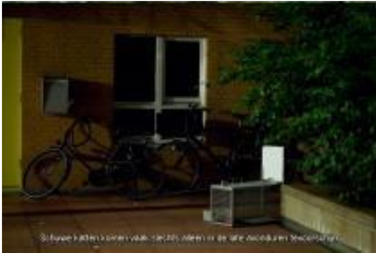
Schuwse katten kunnen vaak te bang zijn om de late avonduren mee te maken.