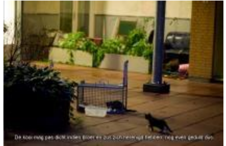
De koolnag past dicht in het bloot en dat zorgt ervoor dat katten nog even geduld draagt.