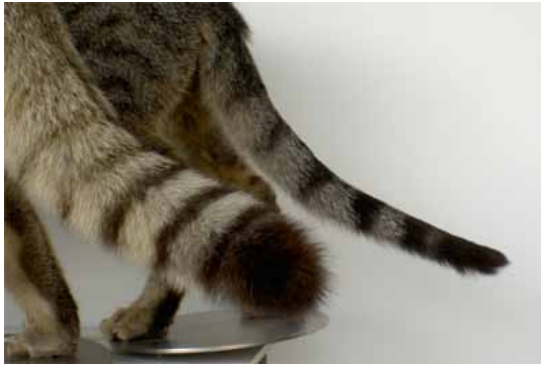
Figuur 1 : De staarten van de wilde kat (vooraan) en de huiskat (achteraan)